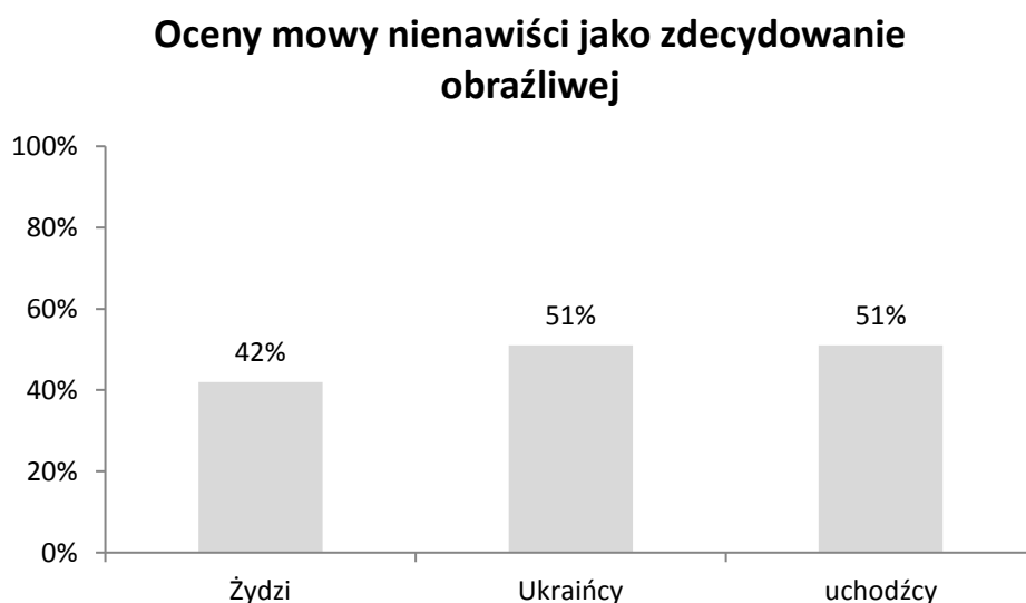
Wykres 1. Średni odsetek Polek i Polaków oceniających przykłady mowy nienawiści skierowanej do różnych grup jako zdecydowanie obraźliwe.

W pierwszej kolejności respondenci oceniali stopień obraźliwości każdej z wypowiedzi, zaznaczając swoje odpowiedzi na siedmiostopniowej skali od „zdecydowanie nieobraźliwe” do „zdecydowanie obraźliwe”. Na wykresie 1 przedstawiono (uśredniony dla badanych grup) odsetek osób, którym wypowiedzi wobec poszczególnych grup wydały się zdecydowanie obraźliwe (skrajna odpowiedź na skali). Można zauważyć, że najmniej osób postrzegło tak wypowiedzi skierowane do Żydów. Możliwe, że mowa nienawiści do Żydów ma w Polsce na tyle długą tradycję, że ludzie są do niej bardziej przyzwyczajeni, nawet znieczuleni i nie traktują jej jako szczególnie obraźliwej.